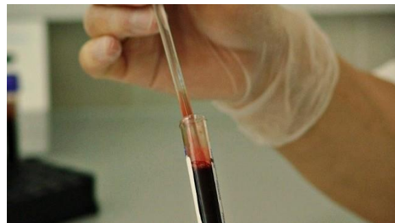
As análises confirmaram que o vírus que já matou três pessoas não é Marburg ou Ebola.